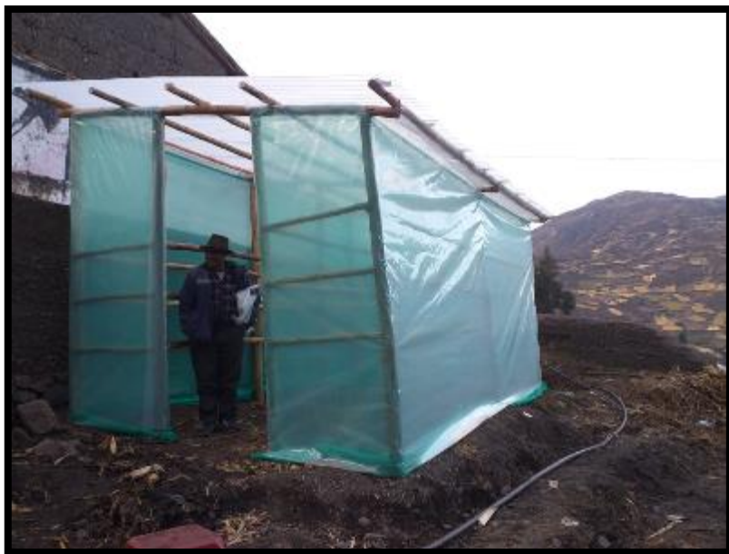
Foto 2. Secador terminado en el caserío de Ruriquilca - Machac, Sr. Anacleto Ramírez Sigueñas