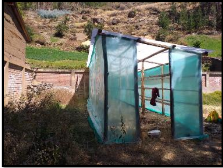
Foto 5. Secador terminado en el centro poblado Uchhuayta - Chavín productor Sr. Mardonio Elías Espinoza