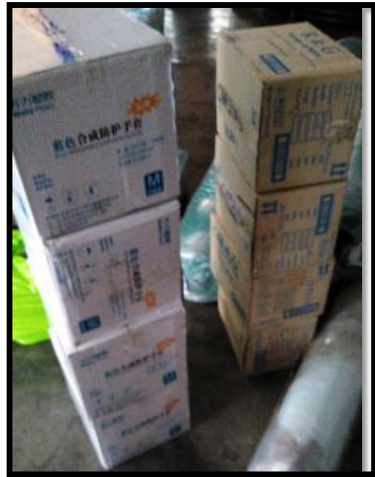
Foto 6. Jabas cosecheras y cajas con mascarillas, guantes, cofias delantales etc para equipar secadores