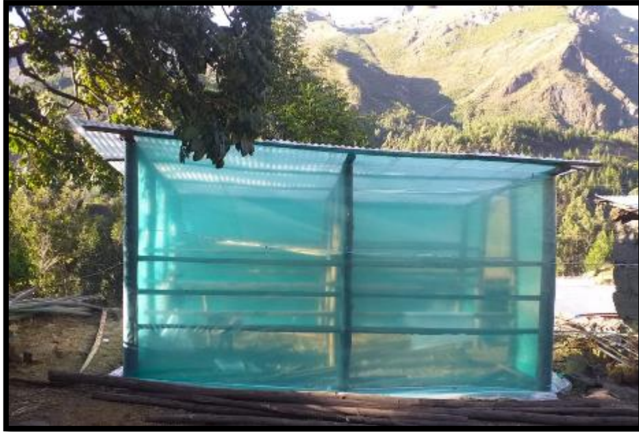
Foto 3. Secador terminado en el centro poblado Uchuhuayta - Chavín productor Sra. Gloria Florinda Matta Baltazar